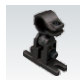
取付金具 R-938 / P.36