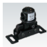
取付金具 BR-1216 / P.36