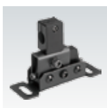
取付金具 R-956 / P.37